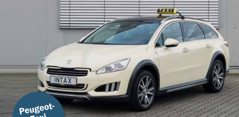
Peugeot-Taxi 508 RXH