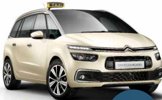
Grand C4 Picasso