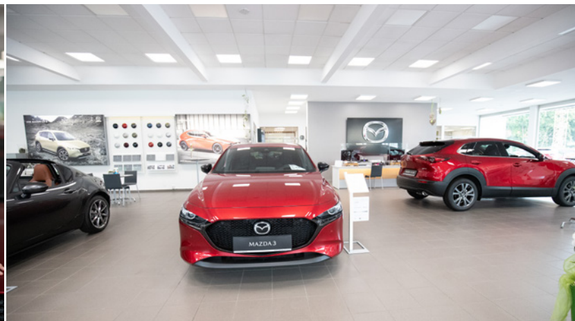
Willkommen in unserem Showroom